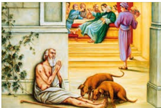
Питча о богаче и Лазаре (Лк. 16:19–31)

Некоторый человек был богат, одевался в порфиру и виссон и каждый день пиршествовал блистательно. Был также некоторый нищий, именем Лазарь, который лежал у ворот его в струпьях и желал напиться крошками, падающими со стола богача, и псы, приходя, лизали струпья его. Умер нищий и отнесен был Ангелами на лоно Авраамово. Умер и богач, и похоронили его. И в аде, будучи в муках, он поднял глаза свои, увидел вдали Авраама и Лазаря на лоне его и, возопив, сказал: отче Аврааме! умиلسердись надо мною и пошли Лазаря, чтобы омочил конец перста своего в воде и прохладил язык мой, ибо я мучаюсь в пламени сем. Но Авраам сказал: чадо! вспомни, что ты получил уже доброе твое в жизни твоей, а Лазарь – злое; ныне же он здесь утешается, а ты страдаешь; и сверх всего того между нами и вами утверждена великая пропасть, так что хотящие перейти отсюда к вам не могут, также и оттуда к нам не переходят. Тогда сказал он: так прошу тебя, отче, пошли его в дом отца моего, ибо у меня пять братьев; пусть он засвидетельствует им, чтобы и они не пришли в это место мучения. Авраам сказал ему: у них есть Моисей и пророки; пусть слушают их. Он же сказал: нет, отче Аврааме, но если кто из мертвых придет к ним, покаются. Тогда Авраам сказал ему: если Моисея и пророков не слушают, то если бы кто и из мертвых воскрес, не поверят.