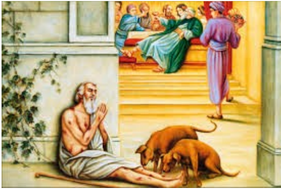
Притча о богаче и Лазаре (Лк. 16:19–31)

Некоторый человек был богат, одевался в порфиру и виссон и каждый день пиршествовал блистательно. Был также некоторый нищий, именем Лазарь, который лежал у ворот его в струпьях и желал напиться крошками, падающими со стола богача, и псы, приходя, лизали струпья его. Умер нищий и отнесен был Ангелами на лоно Авраамово. Умер и богач, и похоронили его. И в аде, будучи в муках, он поднял глаза свои, увидел вдали Авраама и Лазаря на лоне его и, возопив, сказал: отче Аврааме! умиلسердись надо мною и пошли Лазаря, чтобы омочил конец перста своего в воде и прохладил язык мой, ибо я мучаюсь в пламени сем. Но Авраам сказал: чадо! вспомни, что ты получил уже доброе твое в жизни твоей, а Лазарь – злое; ныне же он здесь утешается, а ты страдаешь; и сверх всего того между нами и вами утверждена великая пропасть, так что хотящие перейти отсюда к вам не могут, также и оттуда к нам не переходят. Тогда сказал он: так прошу тебя, отче, пошли его в дом отца моего, ибо у меня пять братьев; пусть он засвидетельствует им, чтобы и они не пришли в это место мучения. Авраам сказал ему: у них есть Моисей и пророки; пусть слушают их. Он же сказал: нет, отче Аврааме, но если кто из мертвых придет к ним, покаются. Тогда Авраам сказал ему: если Моисея и пророков не слушают, то если бы кто и из мертвых воскрес, не поверят.